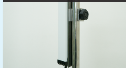
専用金具で IV ポールに取り付けて使用