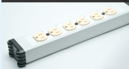
3芯コンセント × 6口