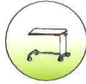
オーバーテーブル