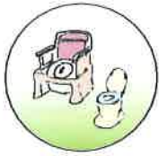
ポータブルトイレ