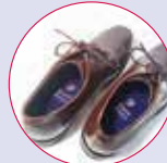
ビジネスシューズ