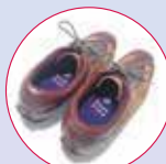
ウォーキングシューズ