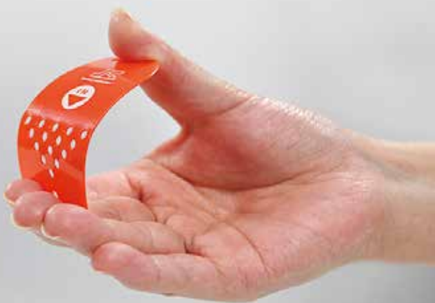
折り曲げに強いPP(ポリプロピレン)使用のカードキー