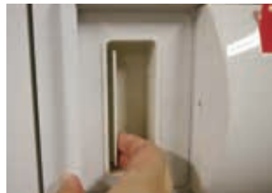
ラッチ付きキャビネット