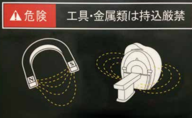
磁場の強い環境にも影響なし

わずかな金属類にも反応するMRIだから、 プラスチック製のカードキーが選ばれました。