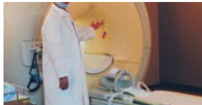
MRI検査室への持ち込み可能