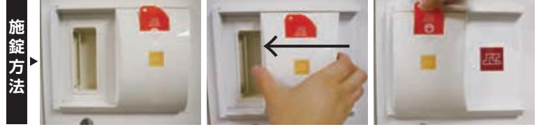
①カードを差込みます。 ②カバーをスライドさせます。 ③カードを抜いて施錠完了。

ロッカーの取っ手を覆うように設置し、アナログのカードキーを差し込んで操作します。カバーをスライドさせて開閉するので、施錠状態、施錠状態がひと目でわかります。