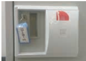
ラッチなしキャビネット

ご使用中のロッカーにキャビロックを取り付けることにより、患者さんはプラスチック(非磁性体)の鍵をMRI室に持ち込み、検査が受けられます。病院で鍵を預かる必要がなくなることも導入の決め手でした。