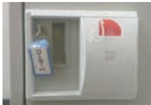
ラッチなしキャビネット

ご使用中のロッカーにキャビロックを取り付けることにより、患者さんはプラスチック(非磁性体)の鍵をMRI室に持ち込み、検査が受けられます。病院で鍵を預かる必要がなくなることも導入の決め手でした。