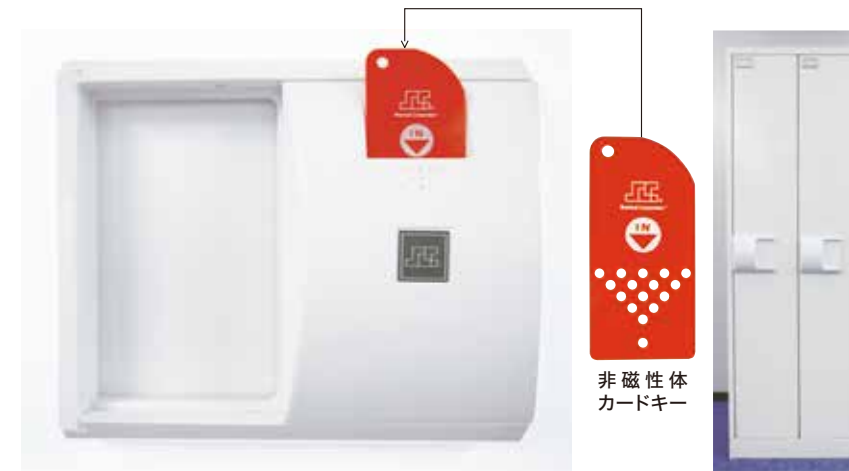
シャーロック キャビロック