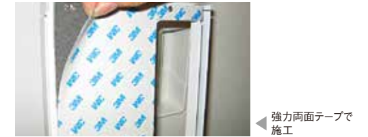
強力両面テープで施工

アナログ式なので、電源や電気工事、特別な加工はいりません。ご使用中のロッカーに、そのまま簡単に取り付けできます。 ※両面テープの強度についてはお問い合わせ下さい。