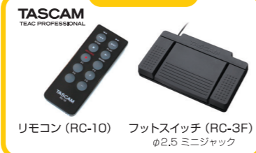
リモコン (RC-10) フットスイッチ (RC-3F) φ2.5 ミニジャック