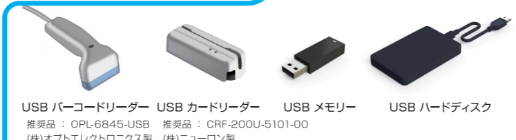
USB バーコードリーダー USB カードリーダー USB メモリー USB ハードディスク 推奨品：OPL-6845-USB 推奨品：CRF-200U-5101-00 (株)オプトエレクトロニクス製 (株)ニューロン製

接続可能機器や接続方法など、詳しくは弊社営業または代理店までお問い合わせください。