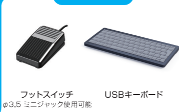
フットスイッチ USBキーボード φ3.5 ミニジャック使用可能