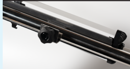
専用金具で IV ポールに取り付けて使用