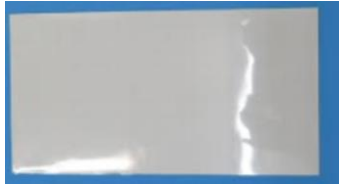
キーボードカバー