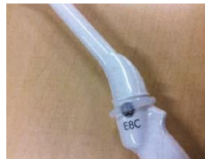
取り付けイメージ